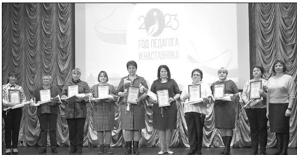
Почетными грамотами администрации района награждены лучшие работники сферы образования.