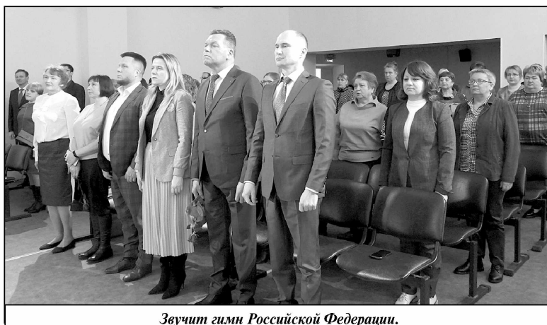
Звучит гимн Российской Федерации.

Вклад выдающегося педагога в развитие российской педагогики просто огромный. Он всю свою жизнь стремился к тому, чтобы образование мог получить любой желающий, а не только избранные слои населения. Это его стремление дало свои плоды, следующие воспитательные системы базировались именно на фундаментальных трудах Ушинского.