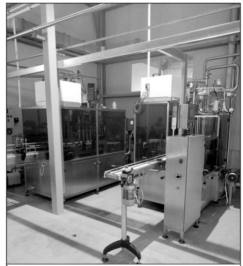
В производственном цехе завода.

несколько уровней контроля качества, в том числе микробиологическое и физико-химическое обследование. Мы делаем все, чтобы продукты были на 100 процентов чистыми, свежими и вкусными.