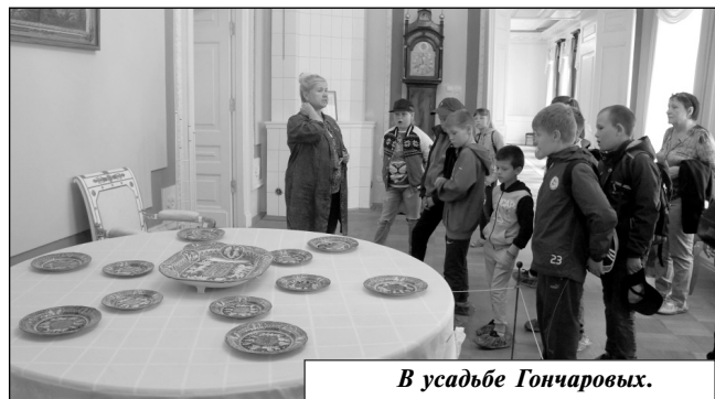
В усадьбе Гончаровых.

поведник «Полотняный Завод», а также музей бумаги «Бузеон».