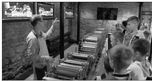
Демонстрация работы станков по производству бумаги.