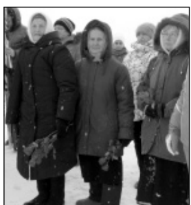
Жители ближайших деревень пришли почтить память солдат, павших за освобождение износковского края.

состоит в том, что он установлен рядом с братской могилой, в которой перезахоронено 92 бойца, и на каждом богослужении в храме читается молитва об убиенных, здесь молятся о тех, кто защитил нашу мирную жизнь.