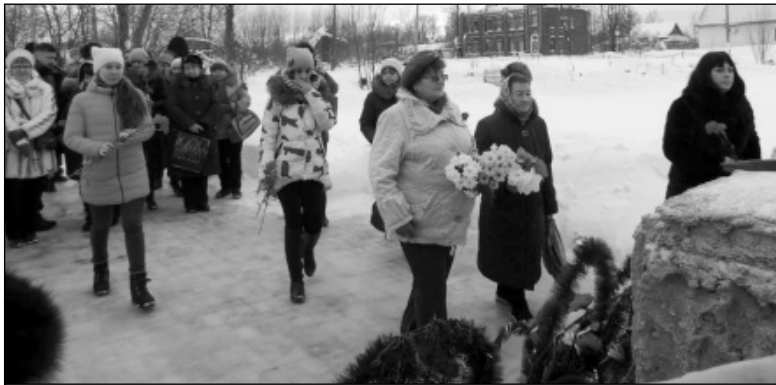
На митинге в железнодорожном сквере.

После того как была объявлена минута молчания, к монументам в