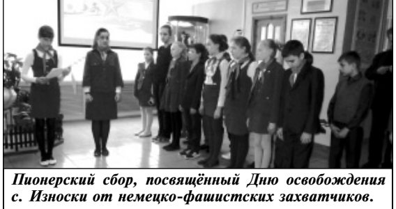
Пионерский сбор, посвященный Дню освобождения с. Износки от немецко-фашистских захватчиков.

P.S. Организаторы акции сердечно благодарят сотрудников ГИБДД и полиции, а также медицинских работников Износковской ЦРБ за активную помощь в проведении мероприятия.