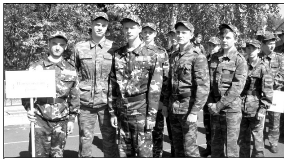
Команда нашего района на областных соревнованиях допризывной молодежи (г. Калуга).

Сборные команды района добились успеха и на более крупных соревнованиях. Так, например, женская сборная команда Износковского района по волейболу в октябре-ноябре 2018 года на чемпионате