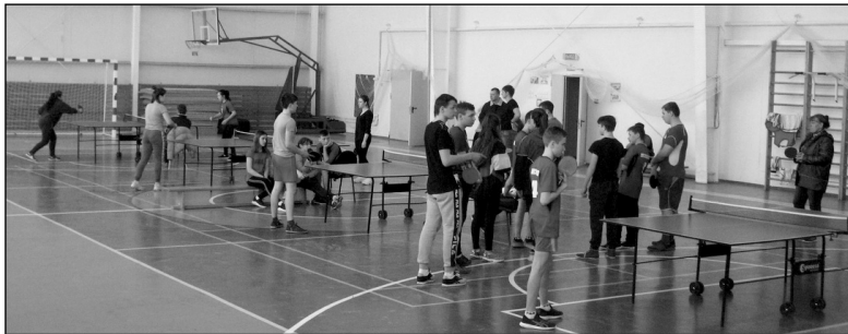
Районное первенство по настольному теннису среди сборных команд общеобразовательных школ нашего района.

Чем же запомнился прошедший спортивный сезон? В первую очередь это организация и проведение на местном уровне спортивных соревнований, а также участие сборных команд в соревнованиях более крупного масштаба - межрайонных, областных и даже всероссийских. Местные районные соревнования организуются учителями физической культуры школ сельских поселений района, а также сотрудниками культурно-спортивного центра «Олимп». Так, за прошедший сезон было проведено ряд соревнований по таким видам спорта, как легкая атлетика, футбол, дартс, волейбол, баскетбол, шахматы, русские шашки, настольный теннис, пулевая стрельба, атлетическая гимнастика, лыжные гонки, мини-биатлон. Самыми крупными соревнованиями, которые прошли в этом сезоне, можно назвать