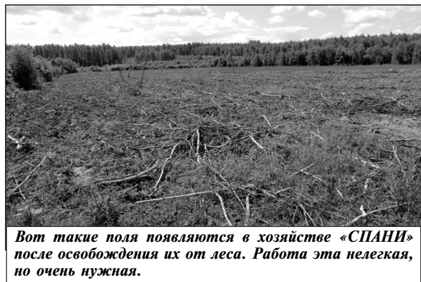
Вот такие поля появляются в хозяйстве «СПАНИ» после освобождения их от леса. Работа эта нелегкая, но очень нужная.

Сложно сегодня говорить о перспективах развития данного хозяйства, ведь на это влияет множество факторов, но если удастся решить дорожные проблемы, а также вопрос газификации, который тоже является актуальным, хозяйство могло бы увеличить свою производительность, так как вся материальная база, земельные и людские ресурсы