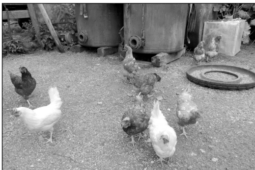
Как курочка по зернышку, так и фермер по копейке.

Что касается дохода, то нельзя не сказать, что ведение сельского хозяйства дело затратное. Все, что фер-