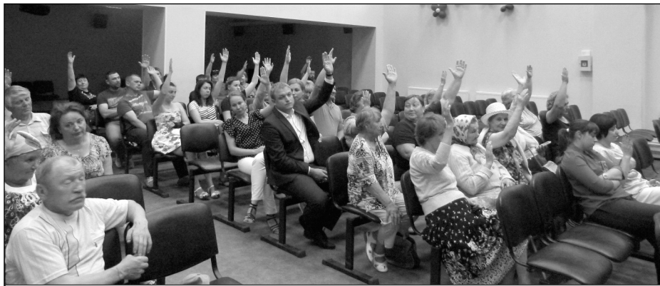
Идет голосование. За место строительства храма на месте старого дома культуры проголосовало большинство.