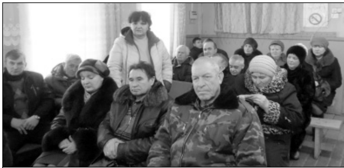
Участники отчетного собрания в МО СП «Деревня Ивановское».

мещений в многоквартирных домах Калужской области». По этому вопросу проводились сходы граждан, и на отчетный период четыре двухэтажных дома по ул. Центральная (№№ 12, 15, 35, 37) включены в эту программу, а по дому № 35 пришли счета на оплату.