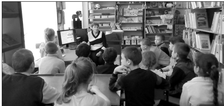
Мероприятие в Хвощах - патриотический час в Хвощевской библиотеке.