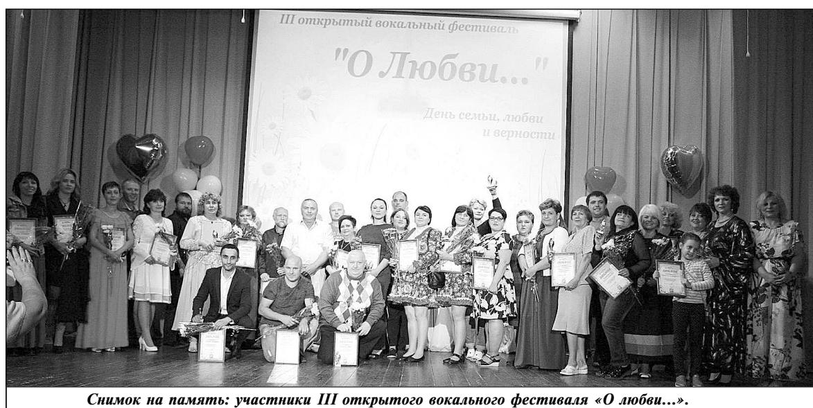
Снимок на память: участники III открытого вокального фестиваля «О любви...».