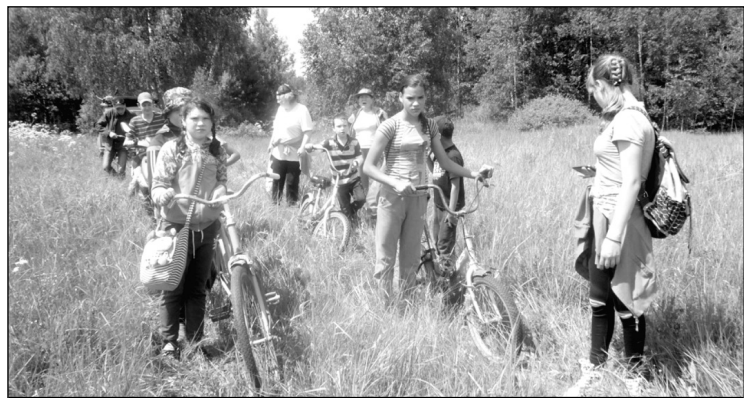
Долгожданное путешествие под названием «поход».

За месяц пребывания в лагере ребята очень сдружились между собой, к концу смены уже не было разделения, кто из какого класса и кому сколько лет - была единая дружная команда летнего лагеря «Робинзон». При подведении итогов летнего отдыха многие учащиеся были награждены грамотами за активность, инициативу, трудолюбие.