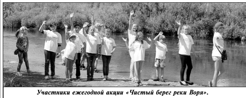
Участники ежегодной акции «Чистый берег реки Воря».

А какой замечательный концерт прошел в лагере в День России. Сколько выдумки, творчества, фан-