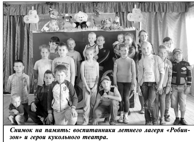
Снимок на память: воспитанники летнего лагеря «Робинзон» и герои кукольного театра.

дети узнали о детских играх, об особенностях быта тех времен, показали свои знания произведений Пушкина; и второе мероприятие никого не оставило равнодушным - «Шоколадный квилт» покорило юных воспитанников лагеря обилием сведений о всеми любимом лакомстве и возможностью участвовать в его дегустации. Мы надеемся, что и в следующем году сотрудники районной библиотеки Л.Г. Ники-