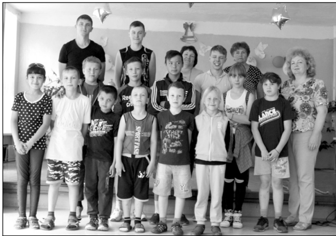
Дружная команда летнего лагеря «Палитра детства».