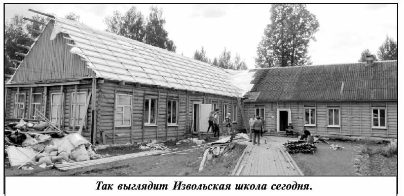
Так выглядит Извольская школа сегодня.

На очередном заседании сельской думы местными депутатами был разработан план инвестиционного развития МО СП «Село Извольское» до