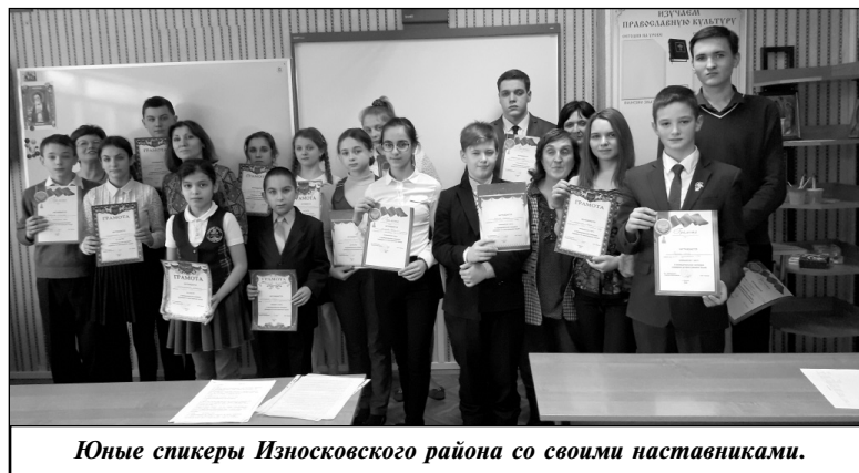
Юные спикеры Износковского района со своими наставниками.