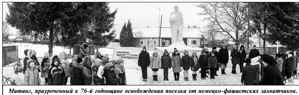
Митинг, приуроченный к 76-й годовщине освобождения поселка от немецко-фашистских захватчиков.

Молодое поколение очень внимательно слушало рассказы о войне, о том, как немцы хозяйничали в поселке Мятлево почти три с половиной месяца. И, хотя до окончания