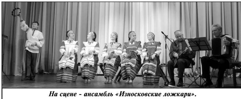
На сцене - ансамбль «Износковские ложки».

культуре Калужской епархии протоиерей Сергей Третьяков, выразивший надежду на то, что конкурс будет развиваться и расти, приобщая все большее число детей и молодежи к русской культуре, бережно сохраняя народные традиции.