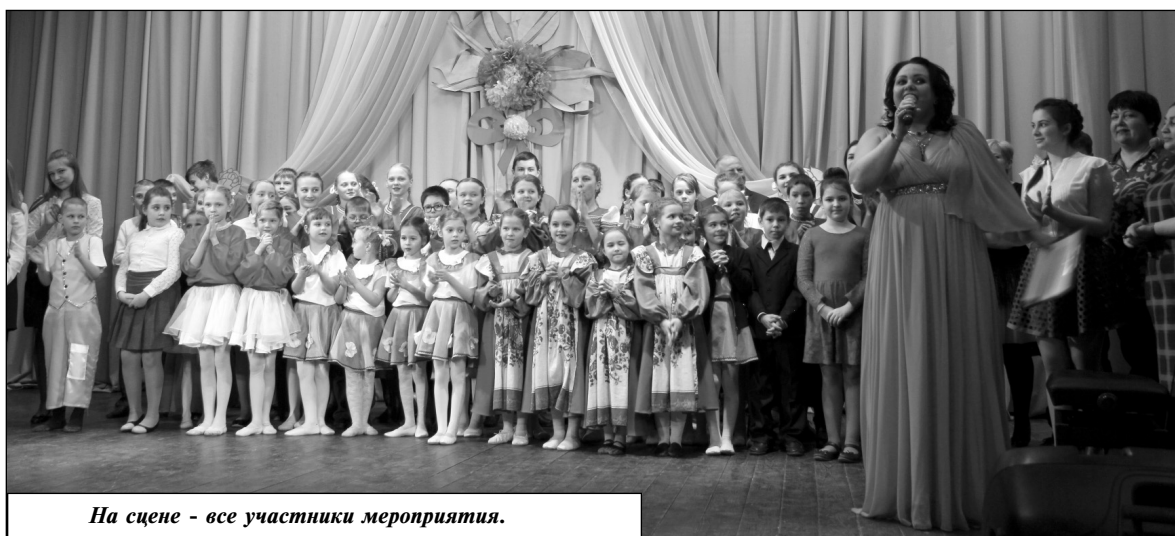
На сцене - все участники мероприятия.