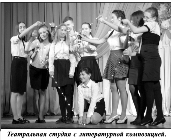
Театральная студия с литературной композицией.