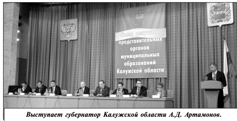
Выступает губернатор Калужской области А.Д. Артамонов.

Губернатор подчеркнул тот факт, что ни одна программа развития в регионе не была свернута. Областная власть меняет существующую финансовую систему таким образом, чтобы