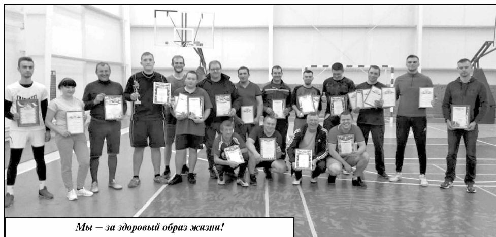
Мы — за здоровый образ жизни!