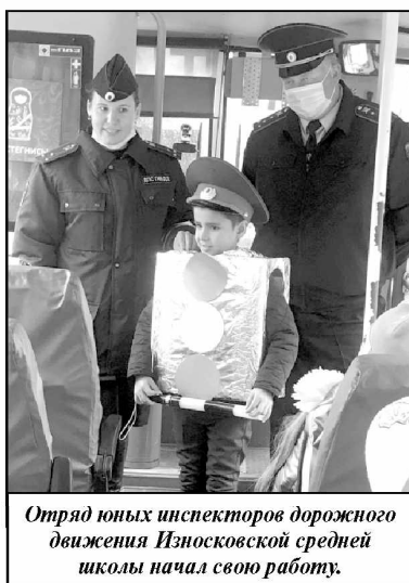
Отряд юных инспекторов дорожного движения Изнаосковской средней школы начал свою работу.

Отряд ЮИД под названием «Светофорчик» состоит из двадцати человек, шестнадцать из которых девочки. Все ребята — ученики 3 класса.