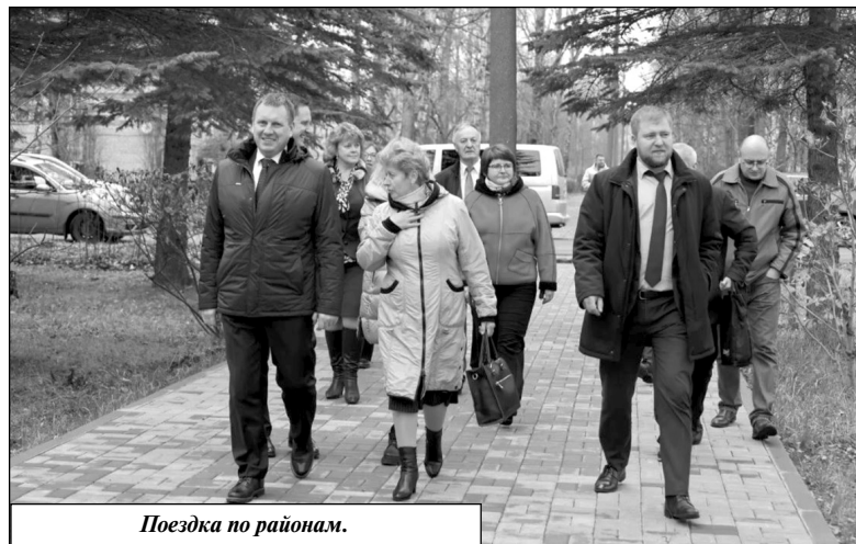
Поездка по районам.