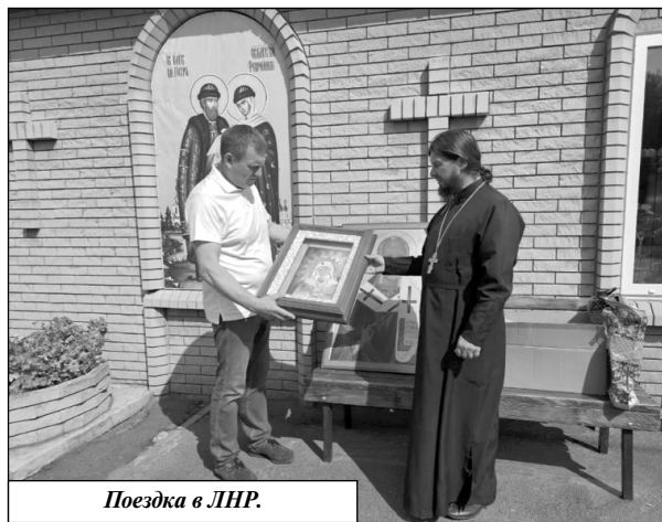
Поездка в ЛНР.

Безусловно, запомнились поездки в Луганскую Народную Республику. Помощь братскому народу и городу Первомайску продолжается. В условиях санкций межре-