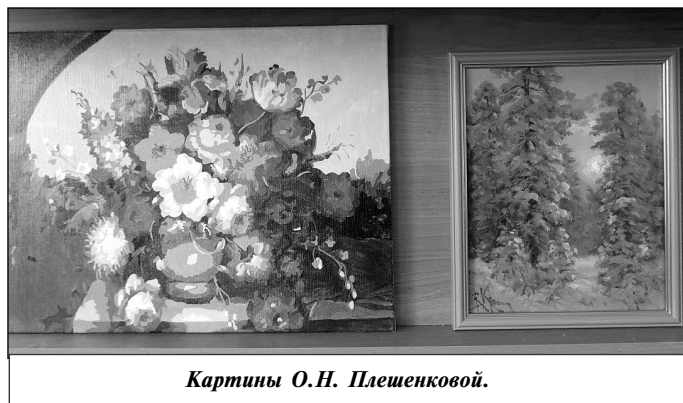
Картины О.Н. Плешенковой.

нужно раскрасить указанным цветом. В наборы входят краски с нумерацией цветов. Задача художника - аккуратно заполнить фрагмент той краской, номер которой указан в нужной области.