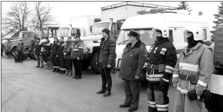
Смотр готовности сил и средств районного звена территориальной подсистемы государственной российской системы предупреждения и ликвидации чрезвычайных ситуаций Калужской области.

Проверку сил и средств осуществляли заместитель главы администрации МР «Износковский район», председатель комиссии по ЧС и пожарной безопасности