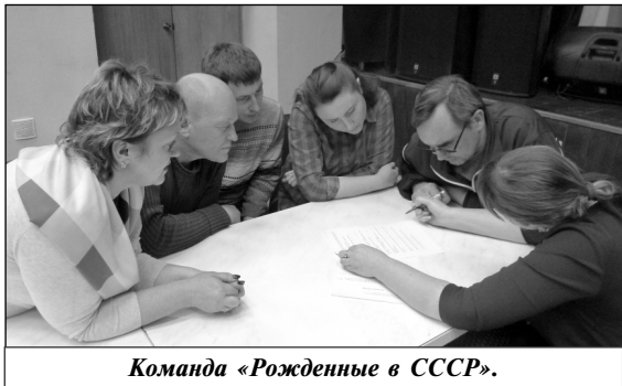
Команда «Рожденные в СССР».