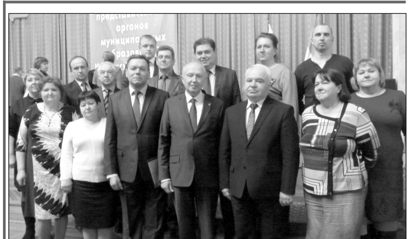
Делегация МР «Износковский район» на XI съезде депутатов представительных органов муниципальных образований области. В центре - председатель Законодательного Собрания Калужской области В.С. Бабурин и руководители делегации - глава МР «Износковский район» П.И. Маркелов и глава администрации района В.В. Леонов.