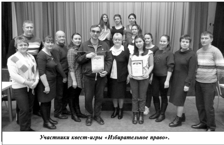
Участники квест-игры «Избирательное право».