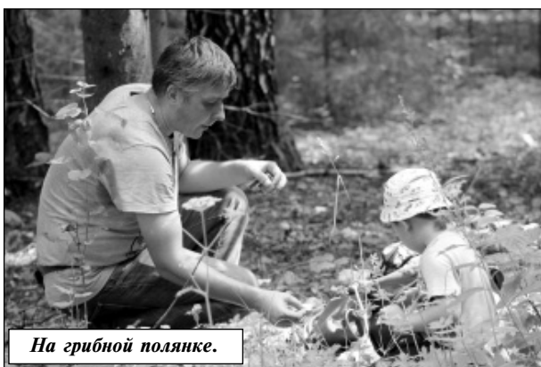
На грибной полянке.