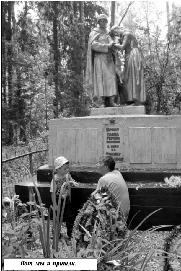
Вот мы и пришли.