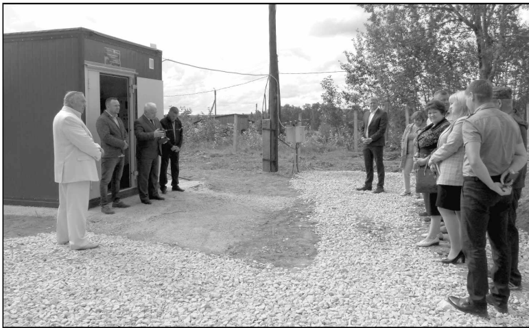
Открытие станции водоподготовки в Износках.

В Износковском районе очистительные сооружения возвели в рекордно быстрые сроки. Еще в июне работники участка Изно-