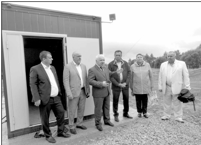
Чистая вода пришла в деревню Ивановское. Торжественное открытие станции.