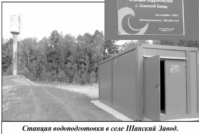
Станция водоподготовки в селе Шанский Завод.

От жителей всего микрорайона бывшего совхоза «Износковский», где я тоже проживаю, хочу сказать огромное спасибо всем, кто приложил немалые усилия для того, чтобы мы не ощущали перебоев в подаче воды и