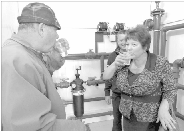
Сельчане пробуют воду, очищенную фильтрами.