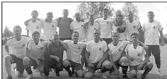
На стадионе Спас-Деменска. Перед игрой.

ская команда «Олимп» занимает первое место в своей группе, и это несмотря на то, что команда Износковского района единственная, которая проводит все игры на выезде, по причине от-