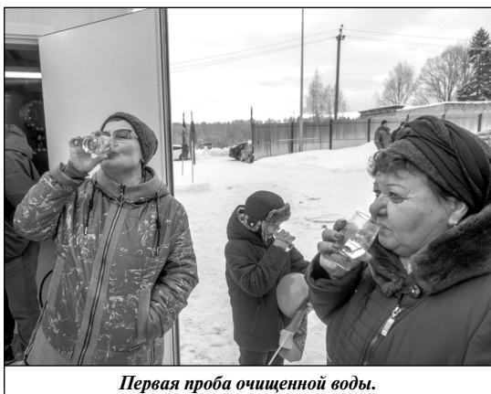
Первая проба очищенной воды.