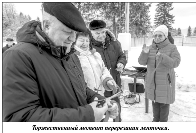
Торжественный момент перерезания ленточки.

становке. Территория была красочно оформлена воздушными шарами и флагами, всех гостей встречали добрый Дед Мороз со Снегурочкой. В мероприятии приняли участие депутаты районного Совета МР «Износковский район» Т.В.