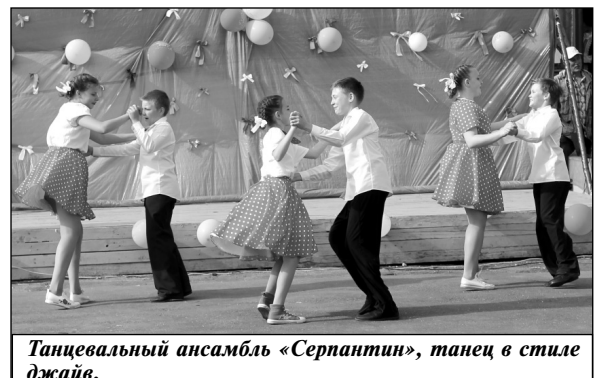
Танцевальный ансамбль «Серпантин», танец в стиле джайв.