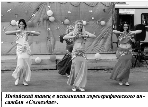
Индийский танец в исполнении хореографического ансамбля «Созвездие».