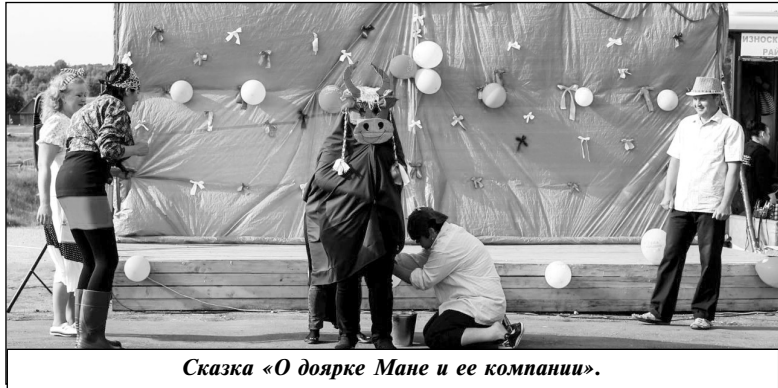
Сказка «О доярке Мане и ее компании».

затем ведем их за руку в школу, а там внуки, правнуки. Такова жизнь... Проходят годы, столетия, и мы, жители, делаем историю своей малой родины. И как приятно, что история нашего села, его становление, развитие, его главное богатство - люди нашли отражение в наших ежегодных праздниках.