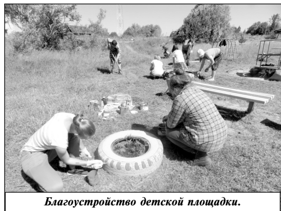
Благоустройство детской площадки.

Особое внимание в ходе работы летнего лагеря уделялось мероприятиям по благоустройству пришкольной территории и территории села. Так, вместе с воспитателями и работниками школы ребята очистили родник, расположенный на берегу реки Шаня. Целый день трудились ребята в центре села. На детской площадке были изготовлены, установлены и покрашены скамейки, обустроены цветники, отремонтированы футбольные ворота. На территории площадки и футбольного поля скошена и убрана трава. Инициативу школы поддержала глава администрации МО СП