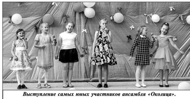
Выступление самых юных участников ансамбля «Околица».

Также на празднике чествовали именинников и юбиляров, молодоженов и тех, кто уже отметил юбилей совместной жизни, а также самых пожилых людей. Село у