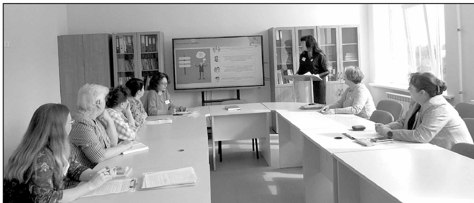
В Мятлевской школе работали две дискуссионные площадки.