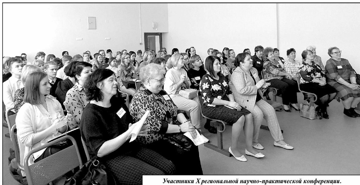
Участники X региональной научно-практической конференции.