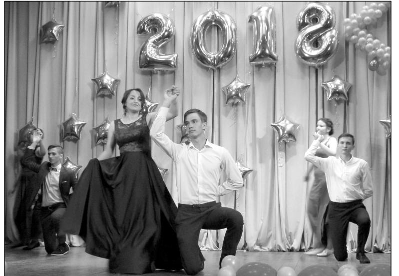
Прощальный вальс выпускников Мятлевской школы.