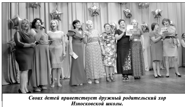
Своих детей приветствует дружный родительский хор Износковской школы.