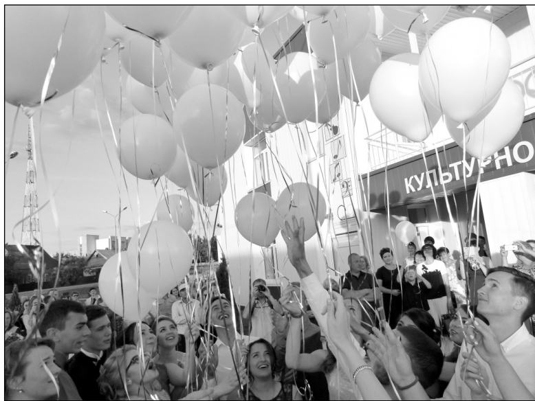
Загадав сокровенные желания, выпускники 2018 года отпускают в небо свои воздушные шары.