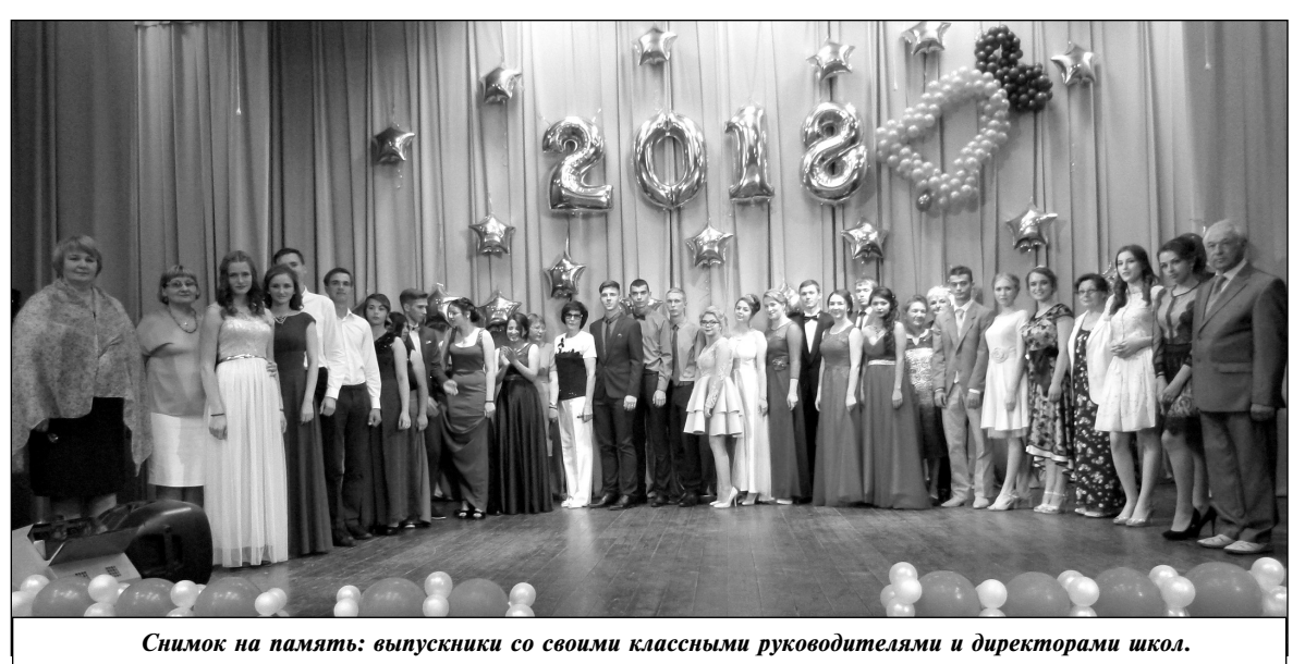
Снимок на память: выпускники со своими классными руководителями и директорами школ.