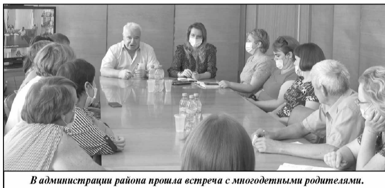
В администрации района прошла встреча с многодетными родителями.

Конечно, во многом эффективность этой работы зависит от федерального законодательства. Но в нашей стране, к