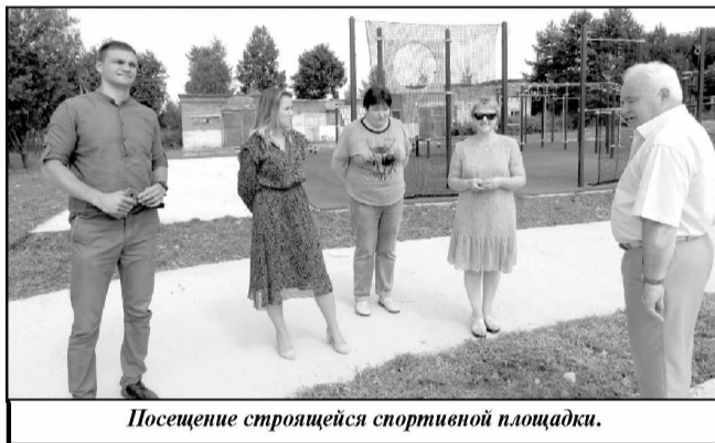
Посещение строящейся спортивной площадки.

ку приезжает детский доктор, но дети болеют не по расписанию», – негодуют износковские мамы и папы. Также много проблем со скорой помощью. Сельчане справляются кто как может, в основном – занимаются самолечением.