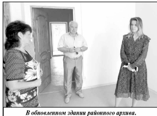
В обновленном здании районного архива.

специалисты вернутся работать в Износковский район. В приоритете, конечно, работники медицины и сферы образования. Администрация района даже готова компенсировать оплату общежития и платить стипендию ребятам, которые учатся по целевому направлению от района. С недавнего