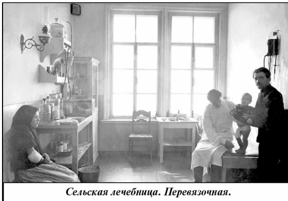
Сельская лечебница. Перевязочная.

Наверняка у многих читателей возник вопрос: а какой штат был в Мятлевском волостном исполнительном комитете, ведь, чтобы охватить все сферы деятельности, необходимы специалисты самого разного профиля. Так вот, штат состоял из трех членов Волоисполкома, шести сотрудников и одного сторожа. При исполкоме также располагались милиция, которая состояла из начальника и трех милиционеров, а также канцелярия фининспектора. Всё делопроизводство волости