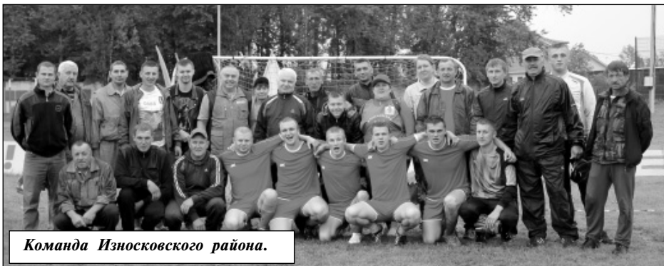
Команда Износковского района.

27 июня 2015 г. в г. Кирове Калужской области прошли XX сельские областные спортивные игры. Износковский район представляла команда, в состав которой вошли более 50 человек, объединившая педагогов, учащихся, студентов, служащих учреждений и администрации района. В торжественном открытии игр приняли участие временно исполняющий обязанности губернатора Калужской области Анатолий Артамонов, министр спорта области Юрий Логинов, министр сельского хозяйства области Леонид Громов, глава администрации Кировского района Игорь Феденков, главы муниципальных об-