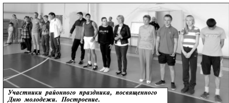
Участники районного праздника, посвященного Дню молодежи. Построение.

В последнее воскресенье июня Россия отмечает День молодежи - праздник молодых людей. При этом возраст, конечно же, к которому относятся молодые, не уточняется. А это даёт повод считать его праздником всех граждан.