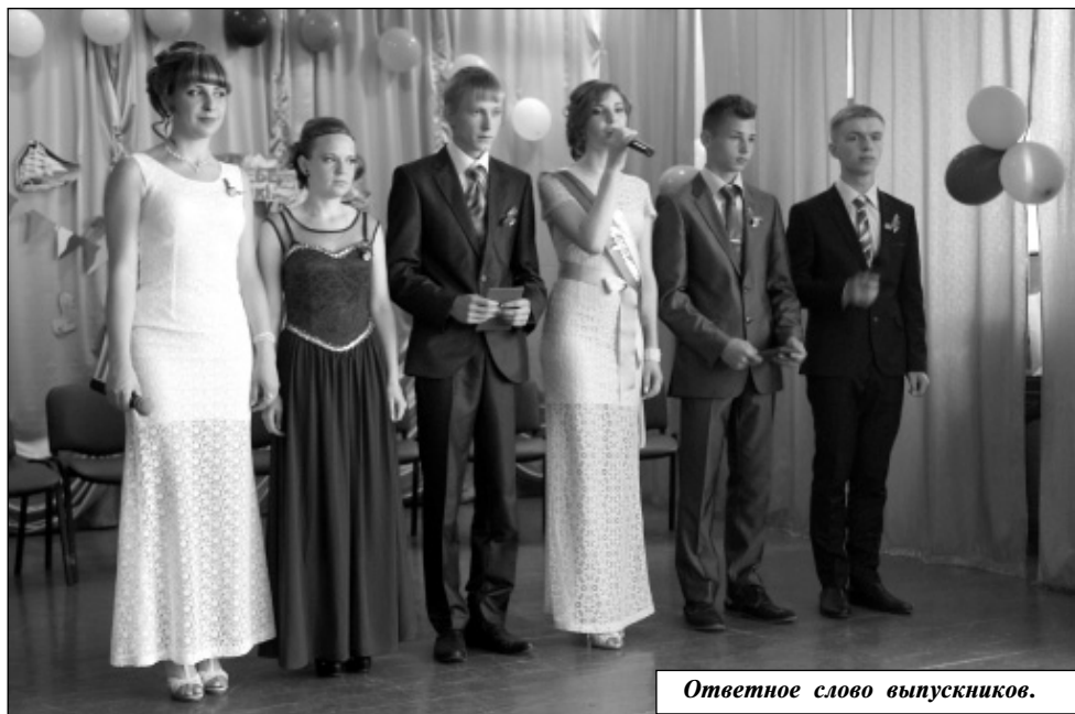
Ответное слово выпускников.

Не остались в долгу и виновники (а точнее - герои!) торжества. Они читали стихи, дарили учителям и родителям прекрасные песни, исполненные светлой грусти; очень артистично в шуточной сценке