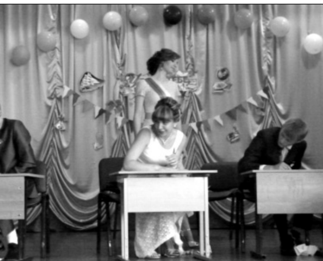
Сценка о ЕГЭ, в ролях - его недавние действующие лица.