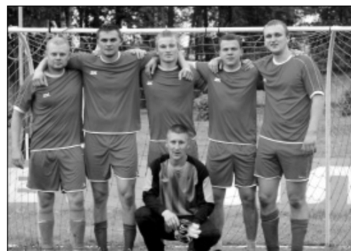
Молодая и перспективная футбольная команда Износковского района на областных сельских спортивных играх в очередной раз доказала, что они - лучшие.