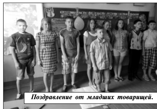
Поздравление от младших товарищей.