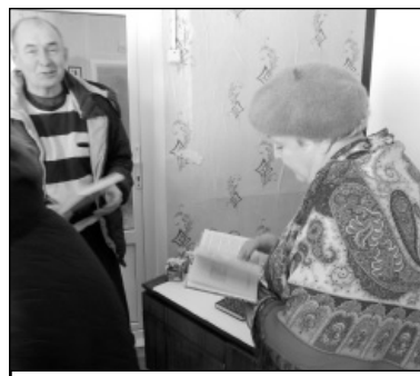
Не иссяк интерес к книге.

до 1991 года рождения. И каждый смог получить подробную информацию по интересующей теме. Примеры сотрудничества библиотеки с отделом ПФР и отделом социальной защиты населения не единичны. Стали традиционными встречи с многодетными и приемными семьями, с инвалидами, празднование Дня пожилого человека, Дня матери, семейные вечера и многое другое.