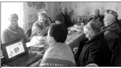
Чайный стол для гостей.

Примером стала встреча специалистов отдела социальной защиты населения администрации МР «Износковский район», отдела пенсионного обеспечения населения и