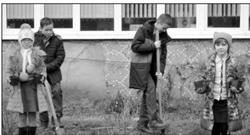
Посадка саженцев туи учащимися 6 класса Износковской СОШ.