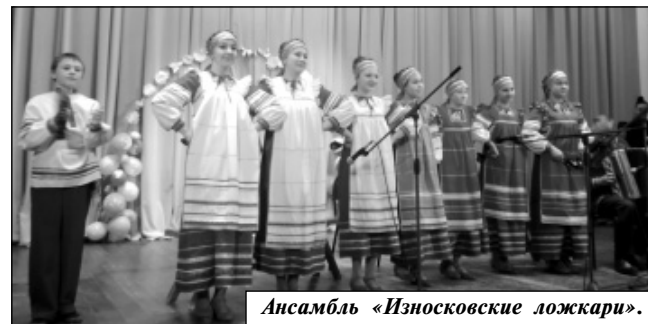
Ансамбль «Износковские ложкари».