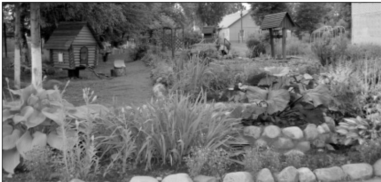
Красота школьного двора Износковской СОШ зачаровывает.