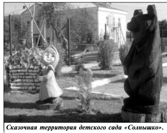
Сказочная территория детского сада «Солнышко».

наблюдаем на территории Износковской средней школы, которая не выглядит стандартно и буднично, а, наоборот, поражает каждого, кто приходит сюда на спортивную площадку или просто погулять по ровной асфальтовой дорожке. И в этом заслуга всего коллектива школы. Летом с самого утра школьный двор наполнен взрослыми и деть-