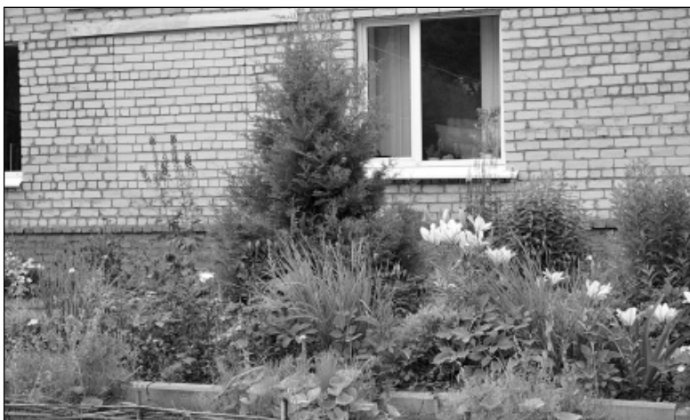
Вот такой дизайнерский ландшафт возле Износковского газового участка.