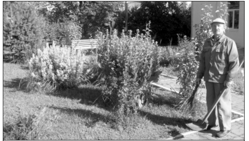
Уборщик территории Износковской ЦРБ В.И. Ремезов, благодаря труду которого здесь всегда чистота и порядок.

Порой для создания комфорта и уюта на участке недостаточно только денежных затрат, необходимо еще и желание поменять что-то вокруг. С любовью ухаживают за тер-