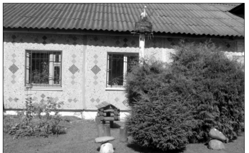
Территория возле Износковского лесничества небольшая, но благодаря фантазии сотрудников здесь всегда есть на что посмотреть и царит порядок.

Прилегающие территории любого учреждения являются его визитной карточкой. И то, что она прилегающая, еще не значит, что каждый имеет право распоряжаться ею как собственным имуществом. Это зна-