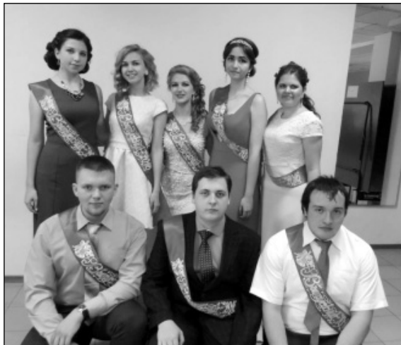
Выпуск-2016 Износковской средней общеобразовательной школы.

В конце июня тысячи выпускников по всей России праздновали окончание школы. Состоялись торжества и в школах Износковского района. Пятнадцать выпускников в этом году получили путевку во взрослую жизнь в средних общеобразовательных школах района. Успешно сдав выпускные экзамены, которые были очень непростыми и проходили вне стен родной школы, ребята по праву заслужили чествование и добрые слова со стороны руководства района, своих наставников и родителей.