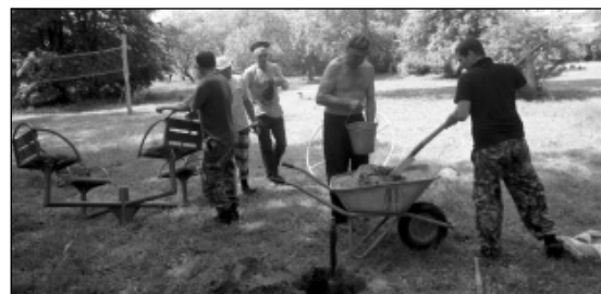
Идут работы по установке детского игрового комплекса.