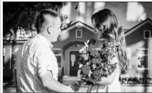
Цветы от благодарных зрителей.

(Материал о праздновании Дня молодежи в п. Мятлево читайте в следующем номере.)