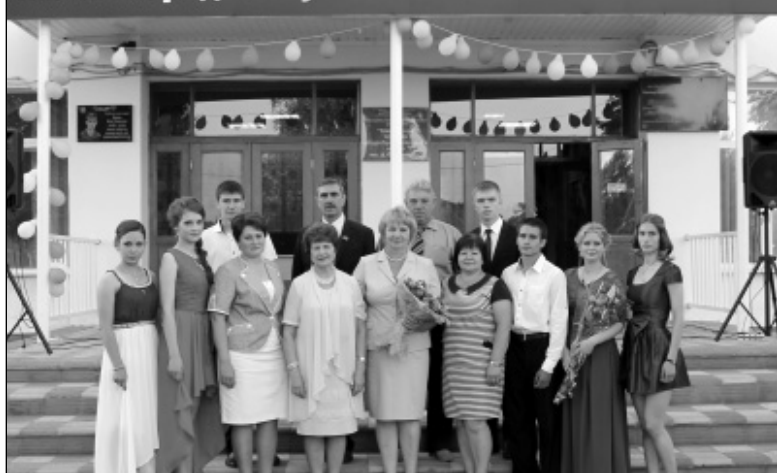
Мятлевские выпускники на парадном крыльце своей родной школы вместе с учителями и почетными гостями.