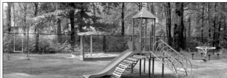
Появление современного детского игрового комплекса значительно украсило территорию МКОУ «Средняя общеобразовательная школа» д. Хвощи.

МКОУ «Средняя общеобразовательная школа» д. Хвощи уют и комфортность, но главное - созданы условия для полноценного детского отдыха. Смех и радость голоса ребятшек теперь раздаются на площадке постоянно.