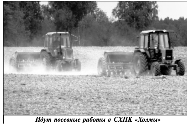
Идут посевные работы в СХПК «Холмы»