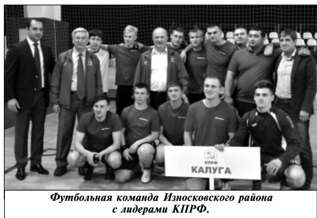
Футбольная команда Износковского района с лидерами КПрФ.

Соревнования проходили в трудной, бескомпромиссной борьбе, так как почти все команды состояли из профессионалов, и нашим парням приходилось нелегко. Несмотря на это, наша команда сражалась достойно, не глядя на ранги и титулы противников, и показала хороший футбол. Наша команда была замечена и отмечена руковод-