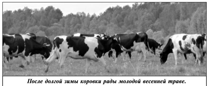
После долгой зимы коровки рады молодой весенней траве.