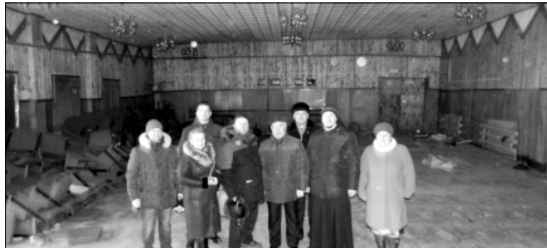
Здесь быть храму! Представители районной власти, церкви и районных служб посетили здание бывшего клуба, чтобы увидеть объем предстоящих работ.