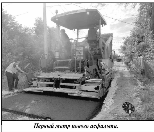
Первый метр нового асфальта.

Там от пересечения с улицей Октябрьской до газового участка сделали современное асфальтовое покрытие. Такое же, как в прошлом году было проложено на более оживленном участке протяженностью 800 метров – от въезда в село до перекрестка, где поток транспорта довольно большой, а из-за образовавшихся с годами ям водители и пешеходы вынуждены были преодолевать настоящую полосу препятствий. В этом году новое покрытие появилось и на оставшемся промежутке протяженностью в 450 метров, где ремонтные работы не проводились довольно давно. За годы эксплуатации грунтовое покрытие пришло в негодность. Проехать на легковом автомобиле по этой дороге стало непросто, да и ходить по грязи пешком – тоже мало приятного. Но теперь местные жители могут забыть