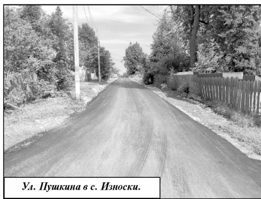
Ул. Пушкина в с. Износки.