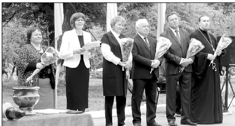
В президиуме торжественной линейки.

Торжественны, трогательно, незабываемы минуты последнего звонка, праздника, которого нет ни