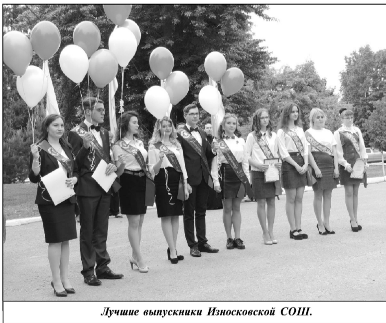
Лучшие выпускники Износковской СОШ.