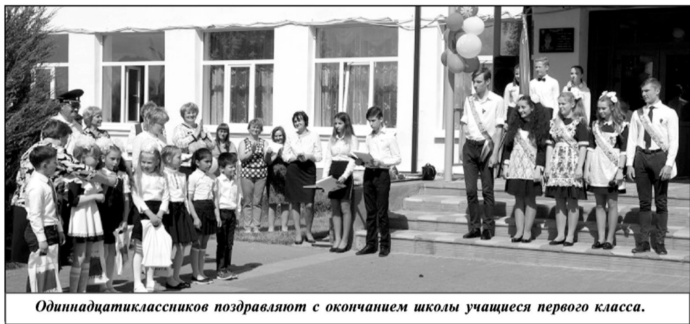
Одиннадцатиклассников поздравляют с окончанием школы учащиеся первого класса.