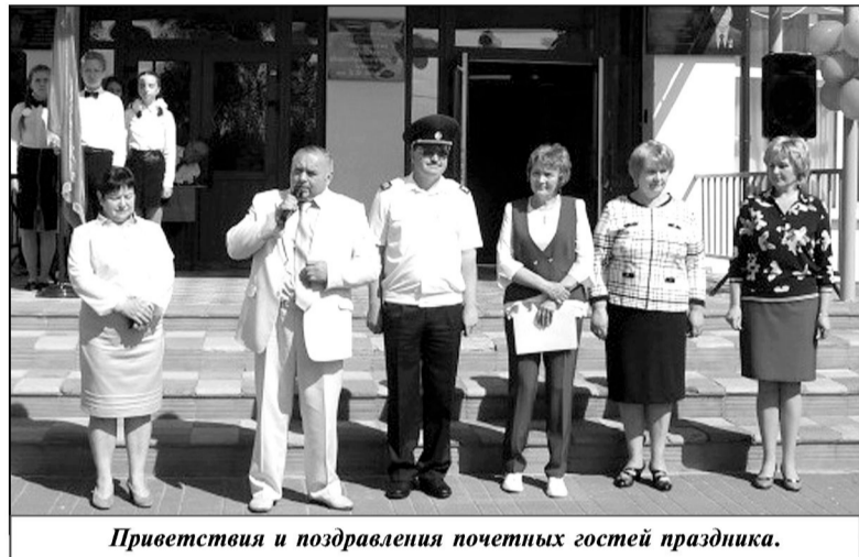
Приветствия и поздравления почетных гостей праздника.

Как ни хотелось отдалить миг расставания, все же наступил