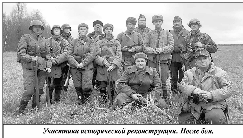
Участники исторической реконструкции. После боя.

Армии при патрулировании территории леса наткнулись на немцев, которые залегли в кустах и открыли беглый огонь по нашим солдатам. Оказавшись под обстрелом, красноармейцы спешно заняли оборону и открыли ответный огонь. Реконструкция боя продолжалась около двух часов, а достоверности всему происходящему добавляла военная форма, которая была на участниках обеих сторон сражения.