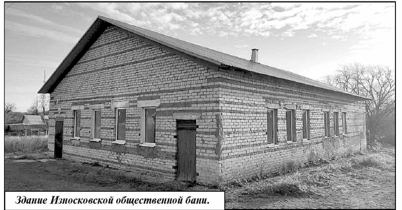
Здание Износковской общественной бани.