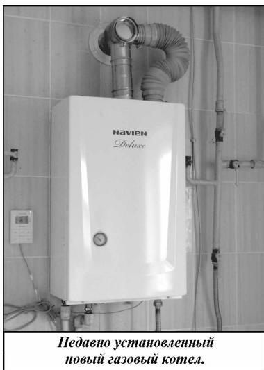
Недавно установленный новый газовый котел.

На сегодняшний день баня давно работает, радуя тем самым любителей воды и пара, а таких людей в нашем районе немало, для них посещение бани своего рода ритуал.