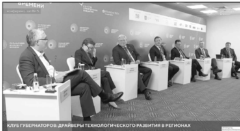
КЛУБ ГУБЕРНАТОРОВ: ДРАЙВЕРЫ ТЕХНОЛОГИЧЕСКОГО РАЗВИТИЯ В РЕГИОНАХ

Министерство внутренней политики и массовых коммуникаций Калужской области.