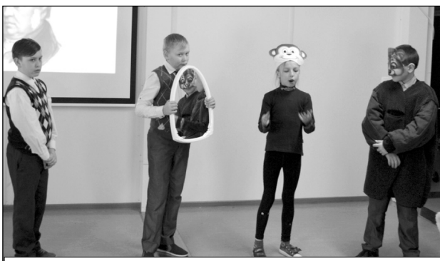
Инсценировка басни «Зеркало и Обезьяна».