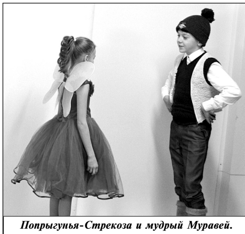
Попрыгунья-Стрекоза и мудрый Муравей.