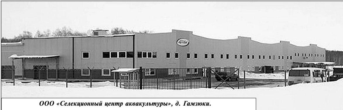
ООО «Селекционный центр аквакультуры», д. Гамзюки.

Комплекс представляет собой четырнадцать отдельно функционирующих технологических линий. Икра для инкубации пока закупается за рубежом, но в ближайшей перспективе предусмат-