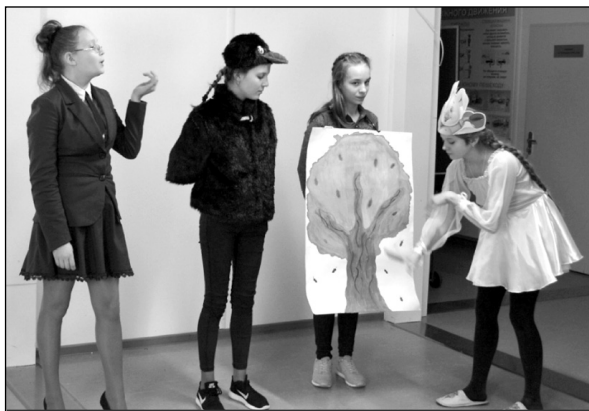
Инсценировка басни «Свинья под дубом».