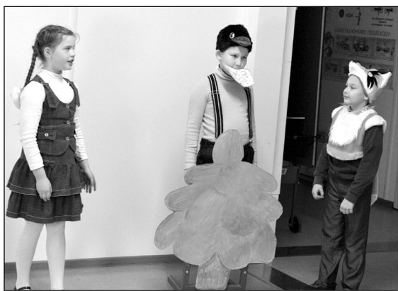
Инсценировка басни «Ворона и Лисица».