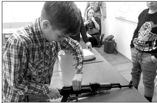
Мальчишек всегда тянет к оружию.