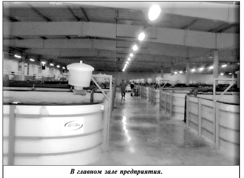
В главном зале предприятия.