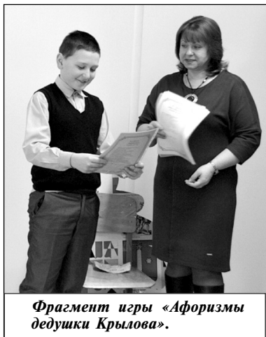
Фрагмент игры «Афоризмы дедушки Крылова».