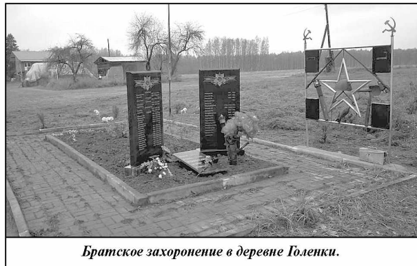
Братское захоронение в деревне Голенки.