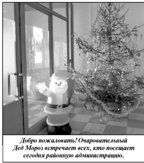
Добро пожаловать! Очаровательный Дед Мороз встречает всех, кто посещает сегодня районную администрацию.

Телефон единой службы спасения 01, для абонентов сотовой связи — «101» или «112».