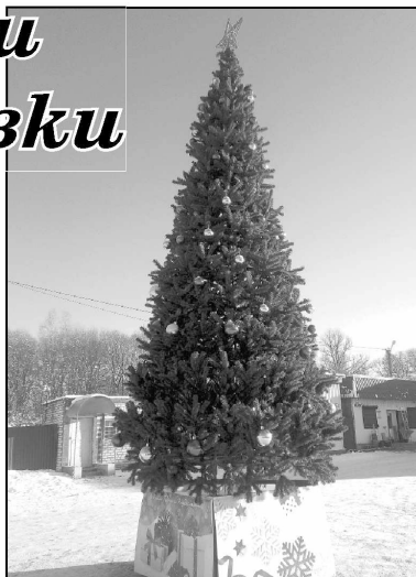
Такая новогодняя красавица установлена на центральной площади села Износки.

На главной площади, то есть в центре села Износки, процесс подготовки идет полным ходом. Вот уже стоит здесь новогодняя красавица ёлочка, большая и пушистая, она