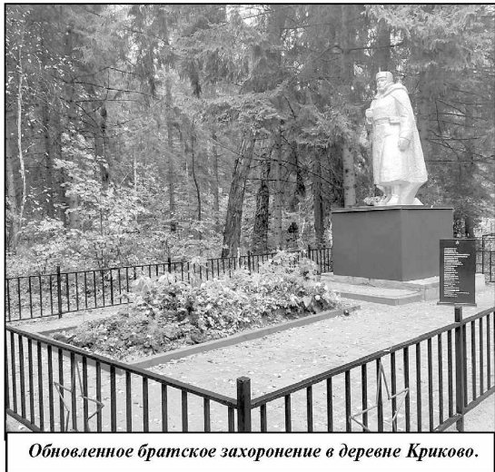
Обновленное братское захоронение в деревне Криково.