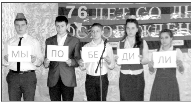
Выступление учащихся Ивановской ООШ в сельском Доме культуры.

В преддверии лыжного пробега на братском захоронении в д. Ивановское состоялся митинг памяти