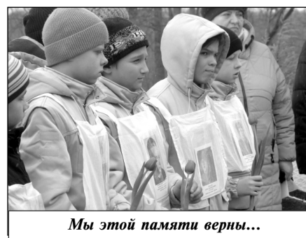
Мы этой памяти верны...

Жабо героически сражался с 4-м полком СС «Мертвая голова». В память о тех героических событиях у каждого лыжника на груди была фотография спецназовца, участвовавшего в бою. Среди них были фото и погибших здесь воинов. Все это было символично. Смотри вслед уходящим вдали лыжникам, многие почувствова-