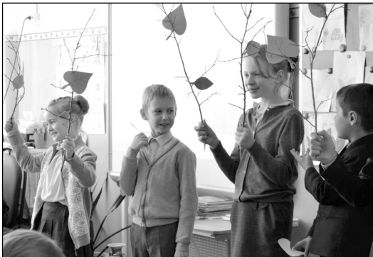
Фрагменты сценок «Чужая ноша» и «Три дерева».