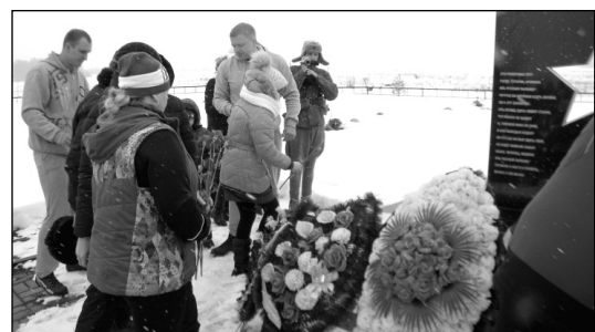
На «Ивановском поле». Мы память сохраним в сердцах навечно...

Завершением памятного мероприятия стал обед. Сол-