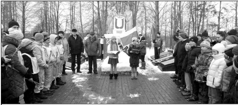
Митинг памяти на братском захоронении в д. Ивановское.

Со 2 по 14 февраля 1942 года продолжалось жестокое сражение за деревню Захарово и соседние с ней населенные пункты. И советское, и немецкое командование придавали ей большое тактическое значение. Немцы успели очень сильно укрепить захаровский рубеж. Его обороняли 4-й полк дивизии СС «Мертвая голова» и другие отборные нацистские части. Само Захарово и соседние с ним деревни немцы пре-