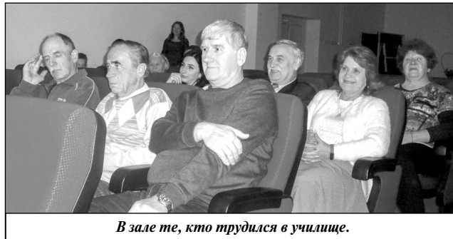
В зале те, кто трудился в училище.

было закрыто. Надо ли говорить, с какой болью встретили мятлевы это известие, ведь училище для поселка было не просто учреждением, где молодые люди получали профессию, а по-настоящему градообразующим предприятием. Государственное профессиональное училище № 20 поселка Мятлево имело 780 гектаров земли, из них 460 гектаров пашни, а за все годы его работы здесь были подготовлены 27 тысяч человек для сельского хозяйства. Здесь всегда трудились настоящие мастера своего дела. Несколько поколений создавало историю училища, и каждое имело свои яркие имена.