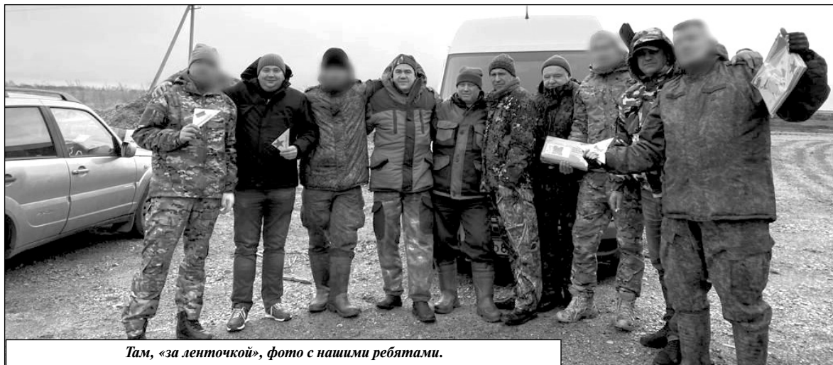
Там, «за ленточкой», фото с нашими ребятами.

Р.С.: Сбор гуманитарной помощи проводится по адресу: с. Износки, ул. Ленина, д. 12, первый этаж (КСЦ «Олимп»), а также в администрациях муниципальных образований сельских поселений нашего района.