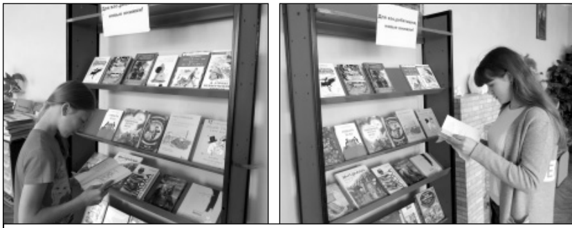
Юные читатели у выставки новой литературы.

но актуально, так как дары читателей являются одним из источников пополнения фондов. Те, кто бесплатно передает книги в фонды библиотек, - люди с высокой гражданской позицией, особым чувством долга перед обществом, прекрасно понимающие, что эти книги найдут своего читателя.