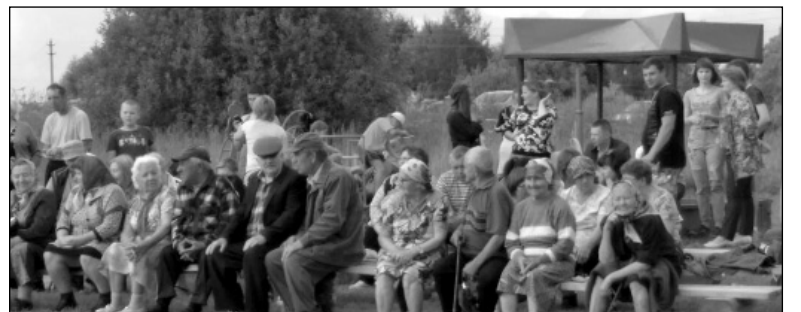
За несколько минут до начала праздничного мероприятия. А зрители все подходили и подходили...