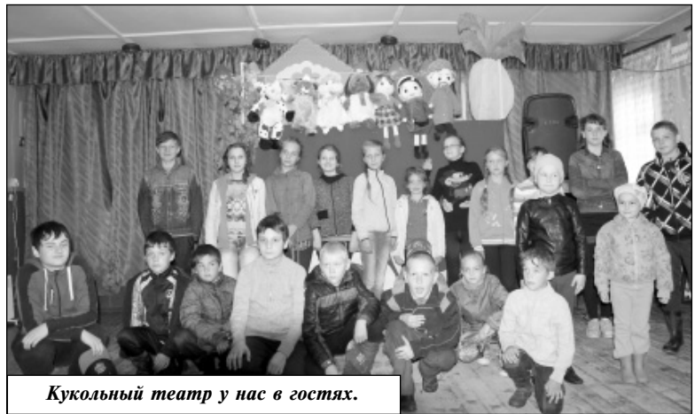
Кукольный театр у нас в гостях.

ема пищи. Воспитатели провели цикл бесед по темам: «О клещевом энцефалите», «Болезни грязных рук», «Уход за кожей летом». Ни одного дня не проходило без подвижных игр на свежем воздухе. Проводились как командные