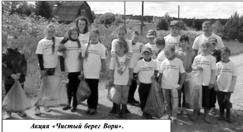
Акция «Чистый берег Вори».