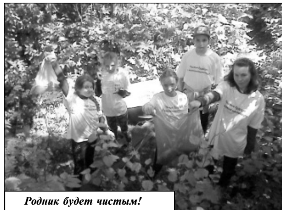
Родник будет чистым!

Для развития экологических знаний учащихся были проведены мероприятия «Экскурсия в Зеленую аптеку» и «Экологическая тропа». Акции «Чистый берег реки Вори» и «Чистые родники окрестностей деревни Ивановское и Собакино» подняли проблему охраны окружающей среды. Викторина «Своя лесная игра» продемонстрировала